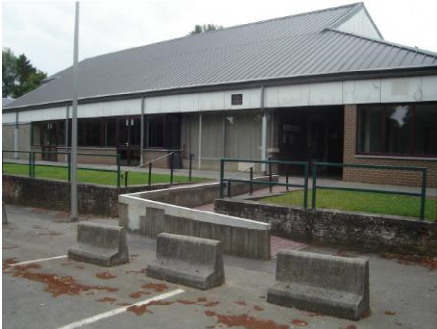
Entrée réaménagée avec rampe inclinée pour faciliter l'accès des personnes à mobilité réduite