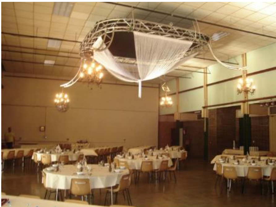
Vue générale de la salle décorée