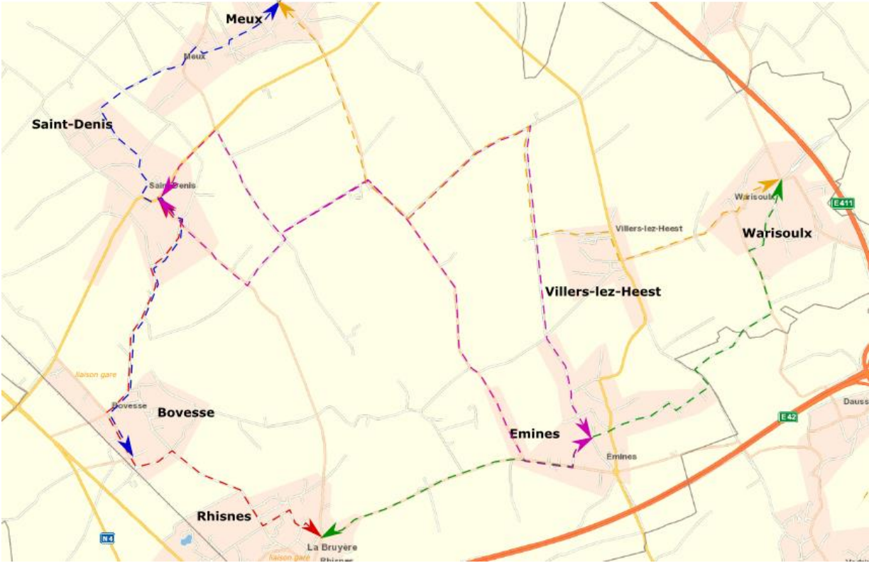
Vue d'ensemble du réseau d'itinéraires pour modes doux à réaliser dans le cadre du PCDR