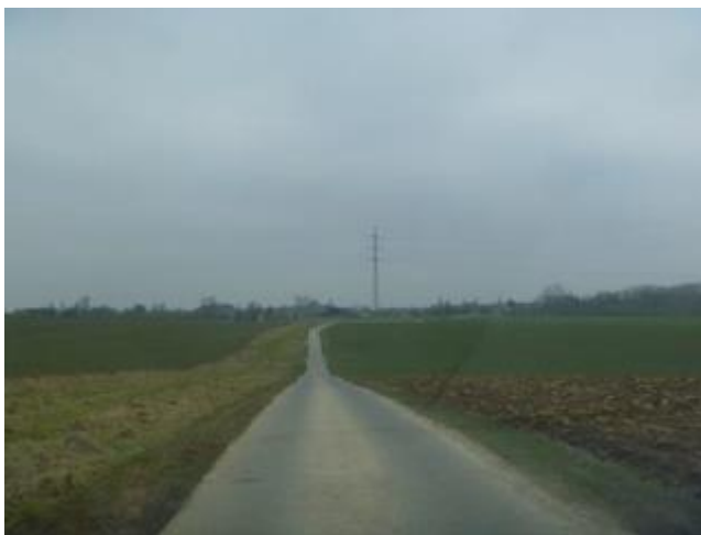
Problème d'inondation au niveau de la rue de la Dime